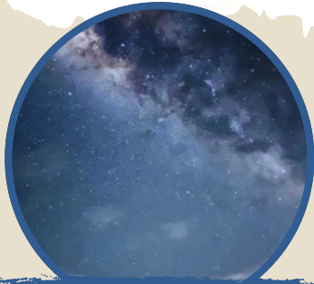
觀星登山之旅 Star-gazing Tour