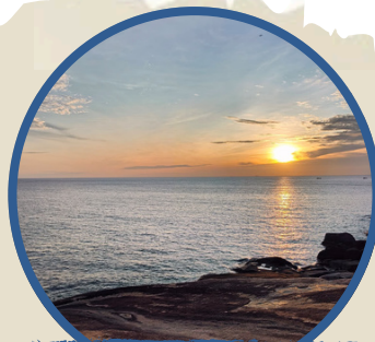
日出登山之旅 Sunrise Hiking Tour