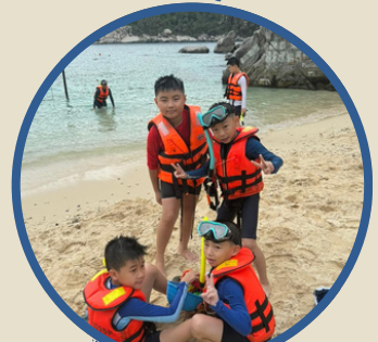
兒童沙灘玩樂 Kinds Play Sand