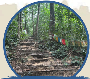
登山步道 Hiking Trail