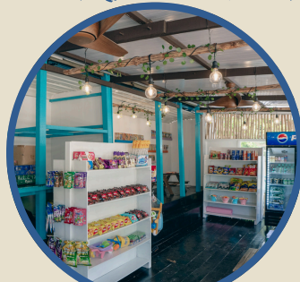
度假便利商店 Convenience Store